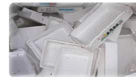
PPバンド・緩衝材・発泡スチロール