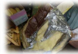
木材(木くず)・クロス(紙くず)・断熱材(ガラスくず)