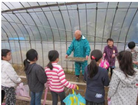
<種まきの説明を聞く児童>

(5) 10月15日に脱穀を行った。昔の道具と今の道具の両方で行った。昔のせんばこきやとうみを利用しての脱穀は、大変だった。みんなで昔の道具を使っての脱穀を経験した後、機械での脱穀は、すごく楽だった。昔の人の苦労がよく分かった。その後、精米し、1月15日に餅つき大会を行った。