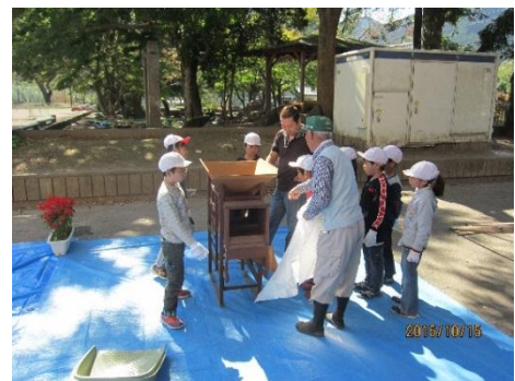
<脱穀の説明を聞く児童>