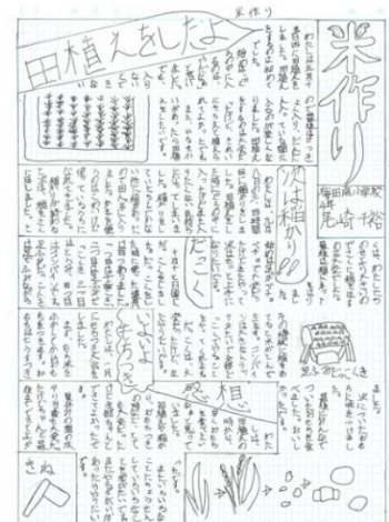
【昨年児童が作成した新聞】

米作りを通して、児童たちは、梅田の自然にふれ、梅田で稲を育てる苦労を知り、梅田の農家の人とふれあう中で、人々のありがたさを感じることができたと思われる。