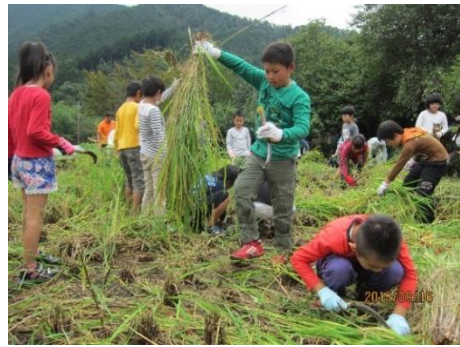
<稲刈りをする児童>