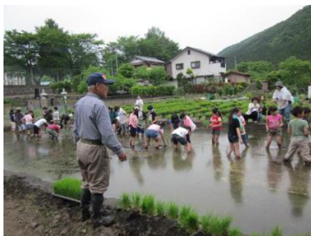
<田植えを行う児童>