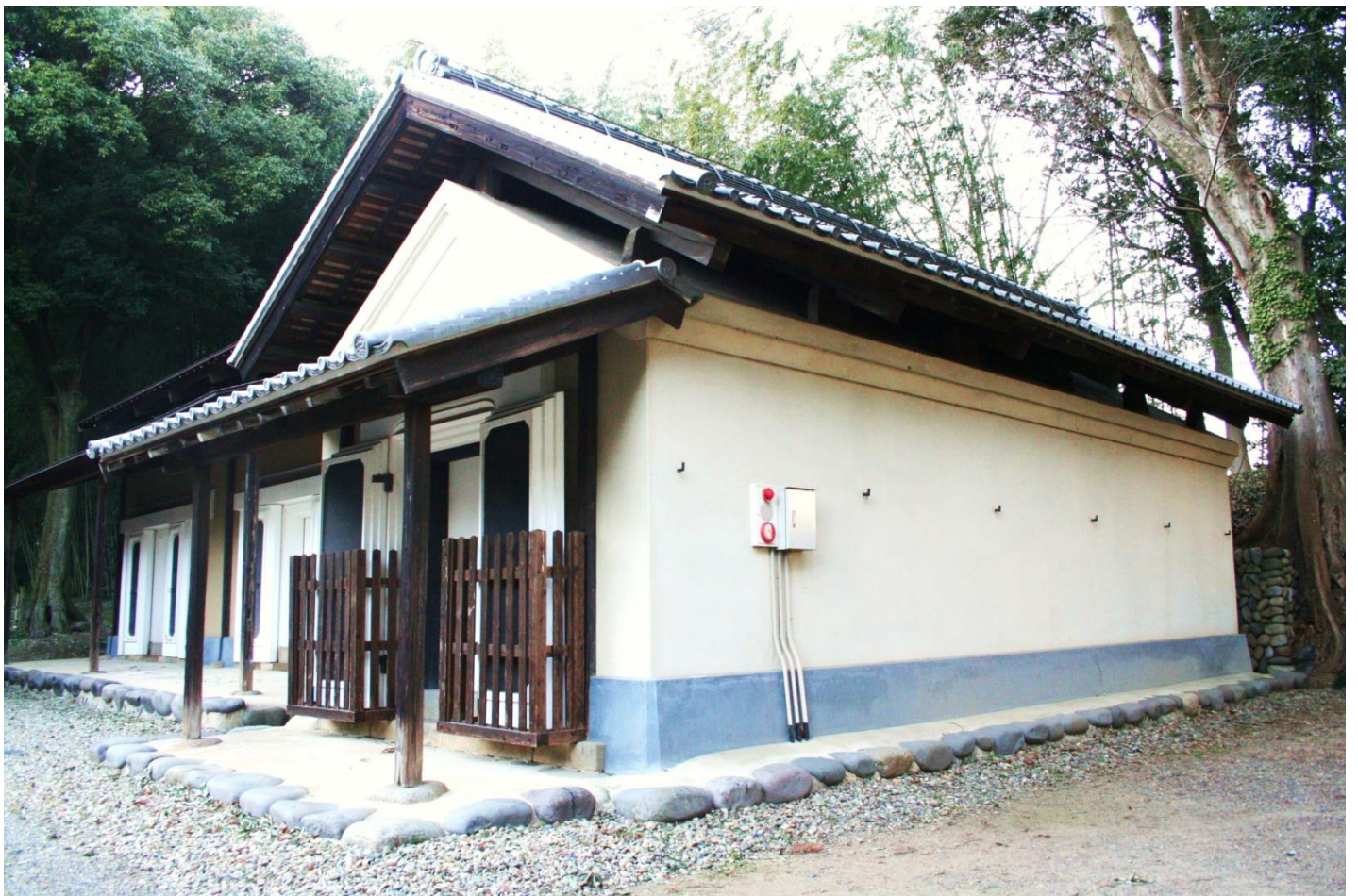
穀倉（東面） 向かって左奥に文庫倉