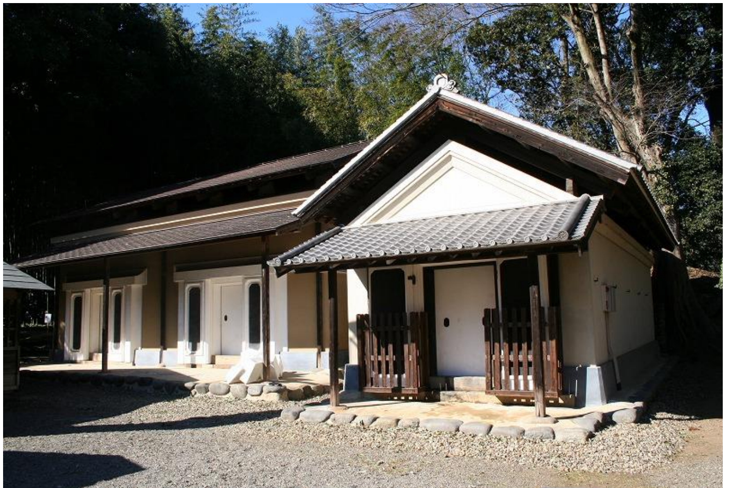
向って左に文庫倉、右に穀倉