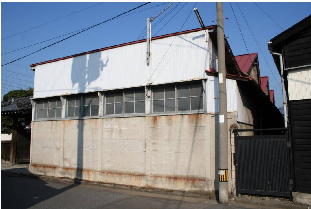
南側からの森秀織物工場