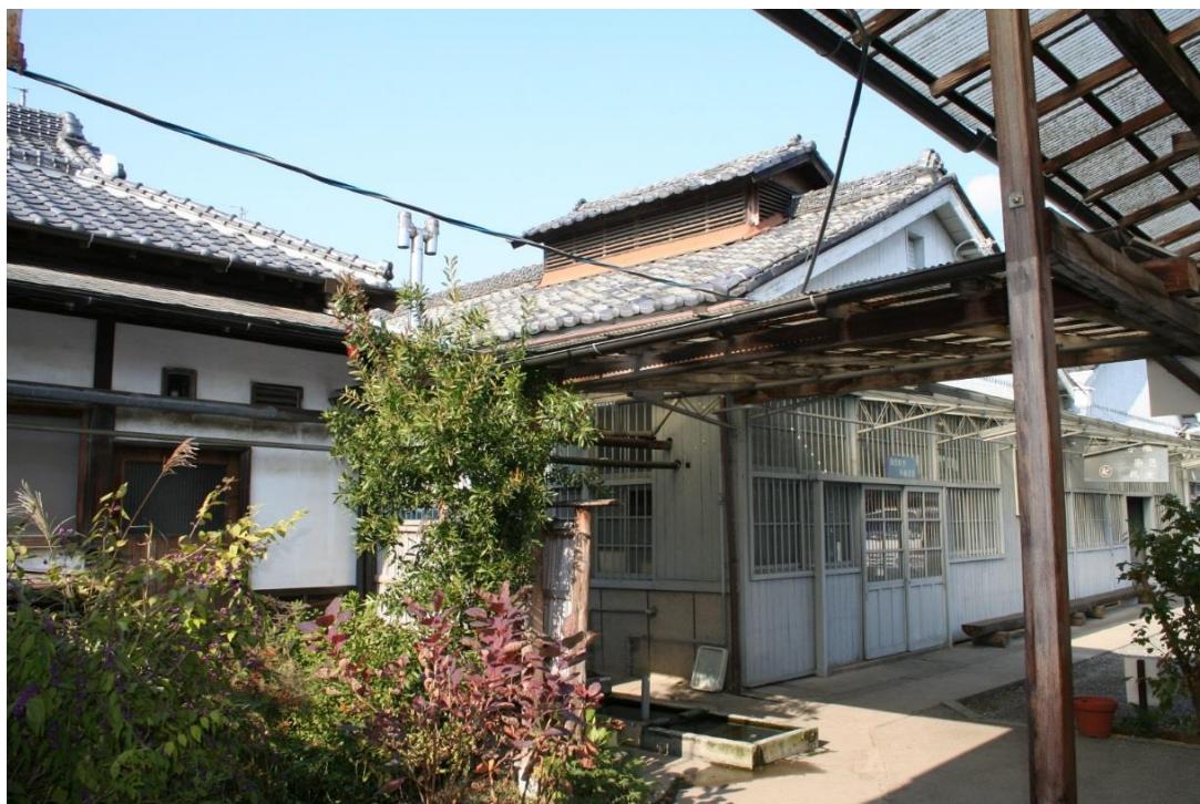
旧釜場（現在 織物参考館「柴」体験学習室）

かつては染色用の釜が設置されていたというが、現在は東西に間仕切り、東側には藍染の甕(かめ)を、西側には手織の織機を置いて、染織の体験学習の場として活用している。