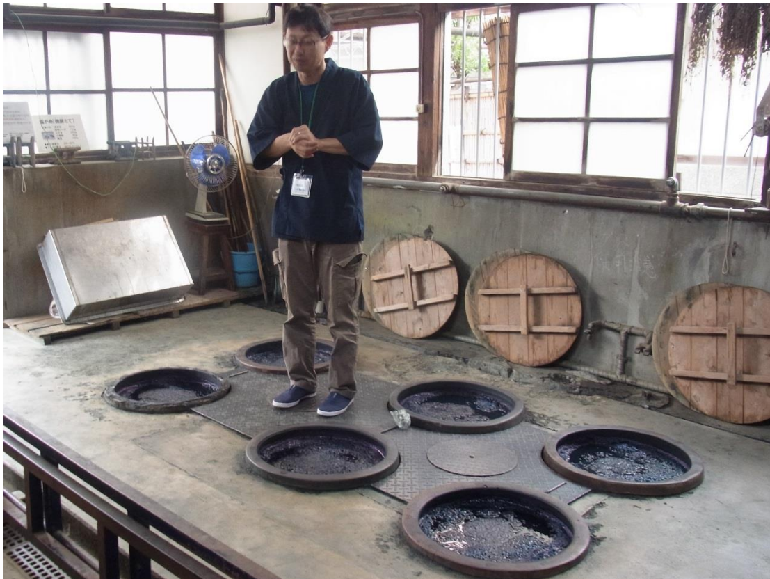
旧釜場内部 (藍染の甕)