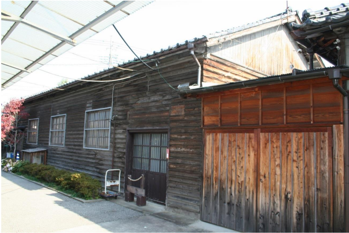
旧撚糸場（現在 織物参考館「柴」学習室及び倉庫）

西に面する木造平屋建、切妻造瓦葺で、小屋組はトラス形式である。南北(桁行)16.9m、東西(梁間)7.52m で、内壁は漆喰塗、外壁は南京下見板張とする。西側の南北双方に出入口を設け、窓には木製の格子がはめ込まれ、工場特有の雰囲気を感じられる。一部屋であったものを中央で仕切り、北半分を学習室、南半分を収蔵庫として利用している。他の工場建築と同じ時期で、大正13年の創建当初と考えられる。