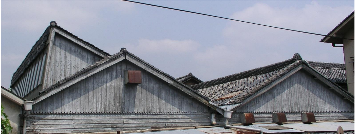
旧整経場 西面より撮影 (現在 織物参考館「柴」展示ホール)

旧釜場の北側に接する木造平屋建、瓦葺鋸屋根造(1連)で、東西(桁行)15.98m、東西(梁間)8.45mの規模である。小屋組はキングポストの形式となっている。東西両側の見える部分は切妻造の形をとるが、屋根全体は鋸屋根形である。外壁の状態や屋根の瓦に共通するところが認められ、旧釜場と同時期の一体の建物であったといえる。