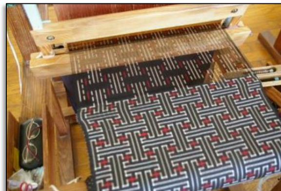
大島紬 「秋名バラ柄」