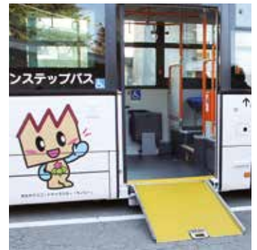
ノンステップバス