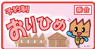
予約制おりひめのロゴマーク(予定)