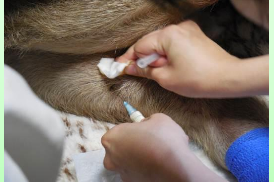
カンガルーに注射を打つ様子

普段から、動物たちの小さな変化に気づけるように定期的に園内を見回り観察をしています。