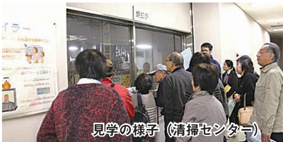
見学の様子(清掃センター)