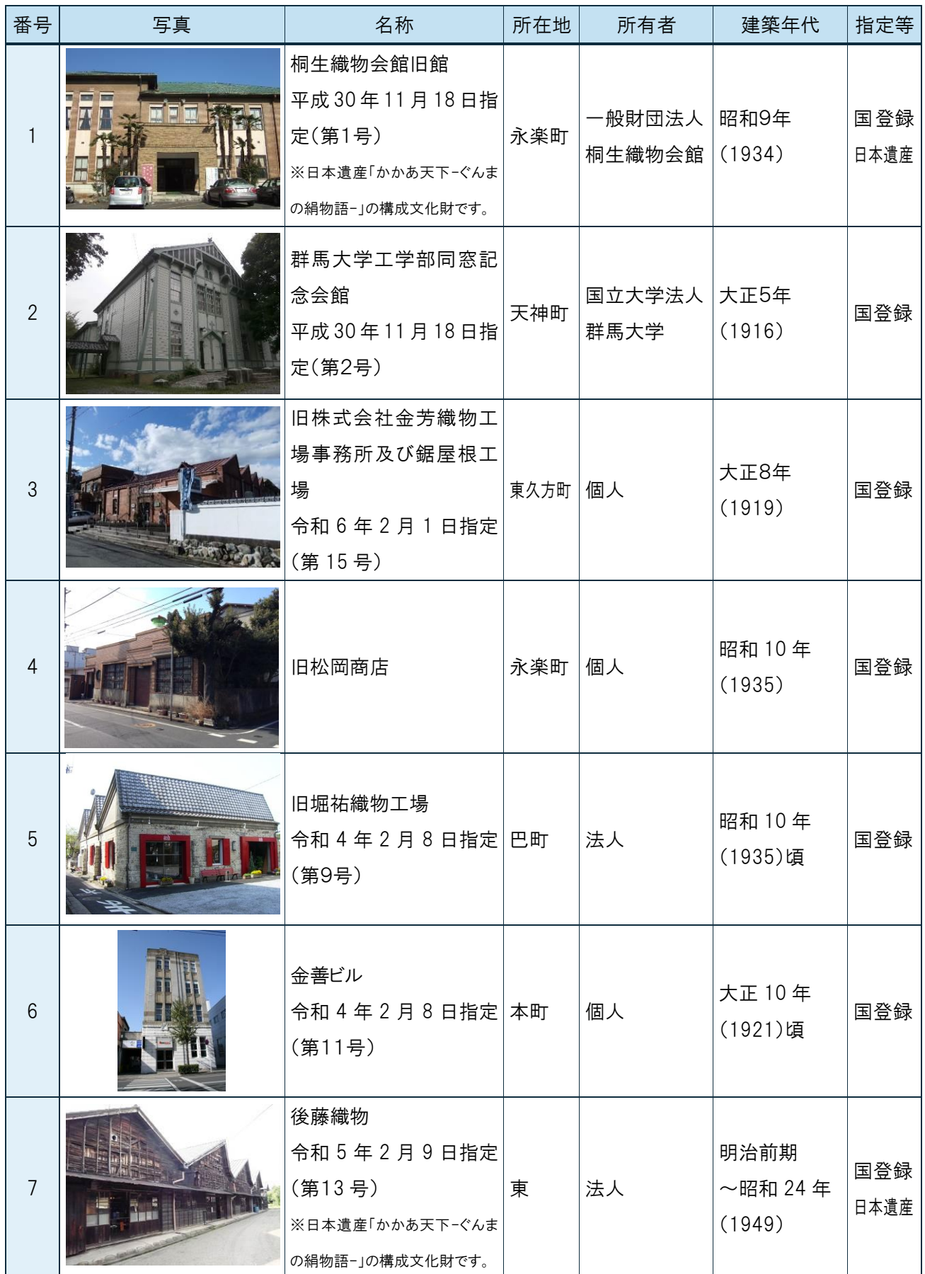
歴史的風致形成建造物指定及び指定候補一覧