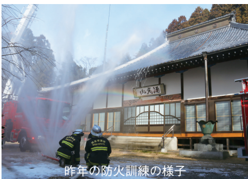
昨年の防火訓練の様子