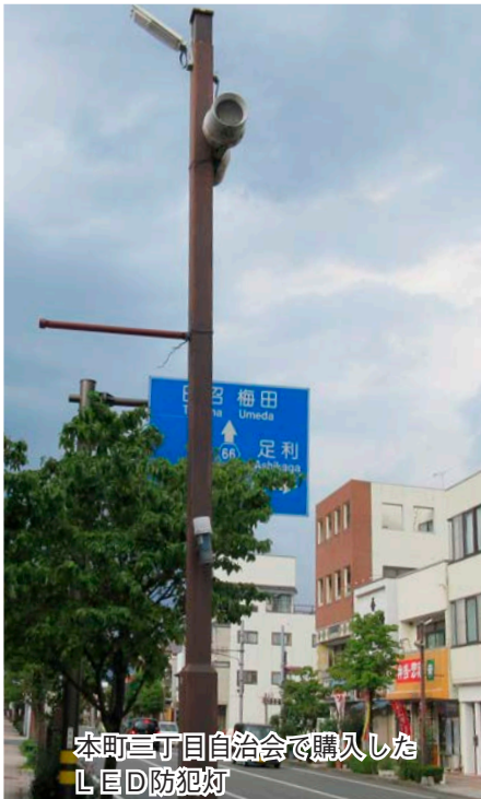
本町三丁目自治会で購入したLED防犯灯