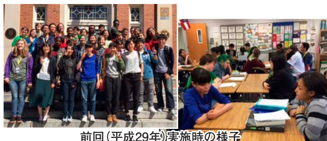
前回(平成29年)実施時の様子

桐生市の国際姉妹都市アメリカ合衆国ジョージア州コロンバス市で、地元の人達との交流や市内見学などを行います。詳しくは、事業実施要領をご覧ください。