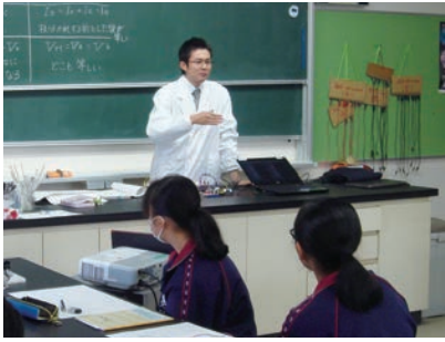
中学校でのサイエンスドクター