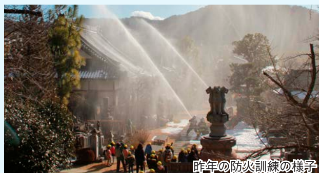
昨年の防火訓練の様子