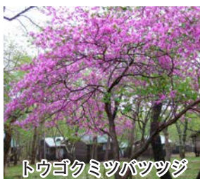
トウゴクミツバツツジ

標高1,200メートルのキャンプ場で、シャワーや食堂施設もあります。森に囲まれたきれいな空気の中で、花の咲く時季や夏を満喫できます。黒檜山への登山道も整備されています。