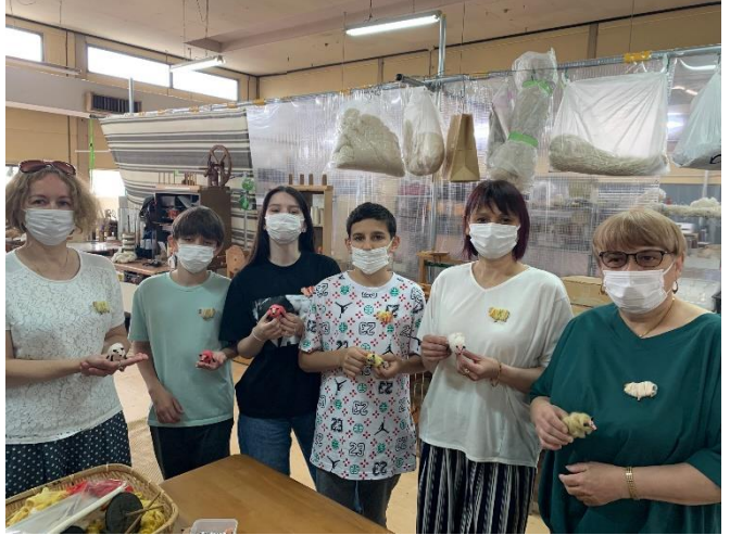
↑ 当協会主催桐生体験ツアー参加時の写真

当協会は、今後も引き続きウクライナ避難者を支援いたす所存です。そして、このような状態から一刻も早く、以前のようにいつでも気軽に往来できる国に戻れることを願ってやみません。