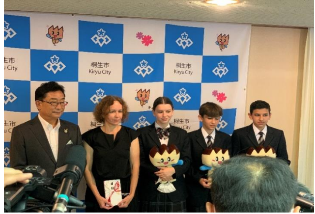
きりゅうしちょう いちじきこく ほうこく 桐生市長に一時帰国を報告

うくらいな ひなんしゃ きりゅうし き がつ くがつよっか きりゅう す ウクライナからの避難者として桐生市に来たみなさん。3月26日から9月4日までを桐生で過ごしま したが、5人のうち、4人が一時帰国しました。