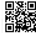
未来創生塾 QRコード