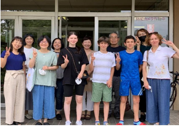
うくらいなひなんしゃ にほんごきょうしつ ウクライナ避難者のみなさんが日本語教室 で勉強しました。(青年の家にて)