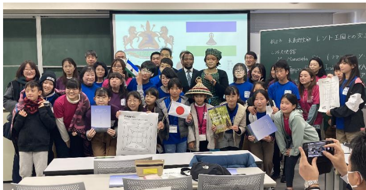
未来創生塾のみなさん