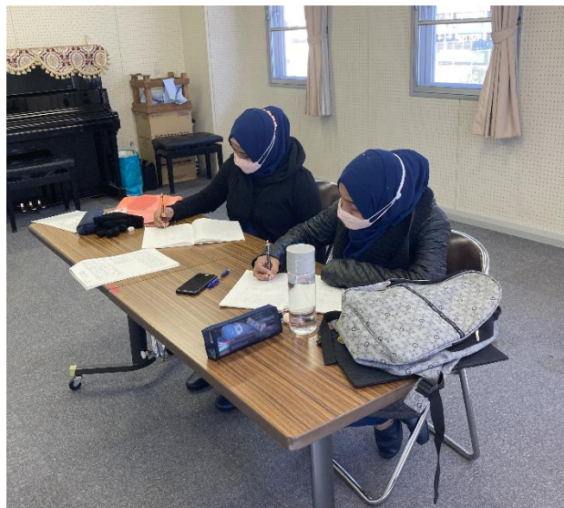
がくしゅう ようす 学習の様子