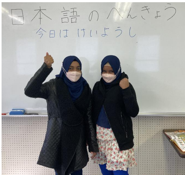
すりらんか しゅうしん しまい スリランカ出身の姉妹