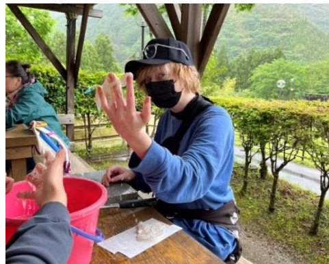
が づ に ち か か み す き たい け ん 5月23日(火)紙漉体験