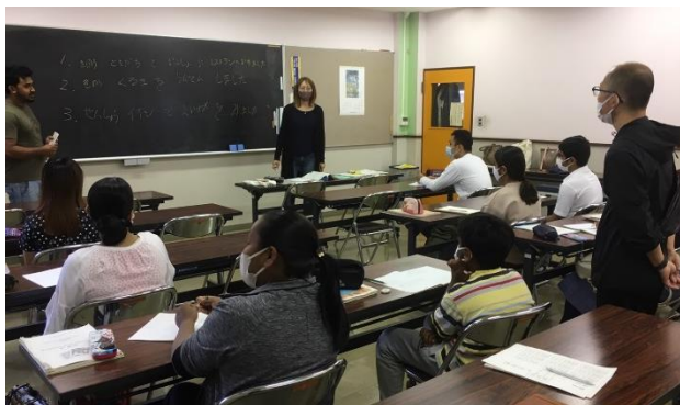
第1期 Cコースの様子

お問い合わせ・申込先 桐生市国際交流協会(地域づくり課内) 〒376-8501 桐生市織姫町 1-1 電話 0277-46-1111 (内線309・537) E-mail kokusai@city.kiryu.gunma.jp ファックス 0277-43-1001