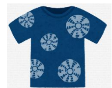
が っ 蕎 麦 屋 一 階 5月24日(水)午後 食と藍染体験