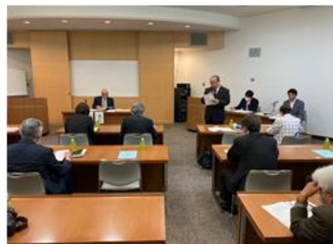
かわしまかんじかんさほうこく 川島監事監査報告