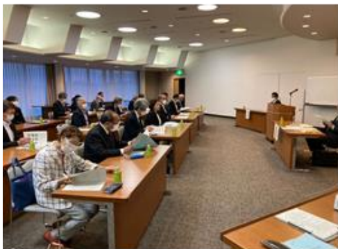
ぎしんこうようす 議事進行の様子