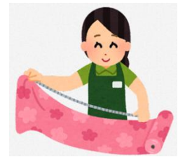
5月21日(日)手織り体験・草木染め体験