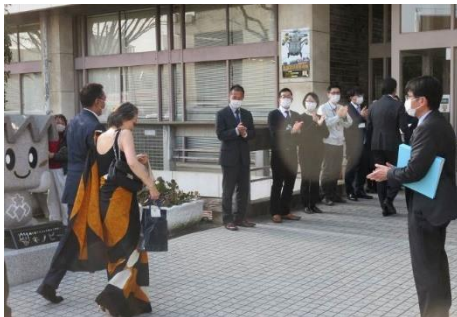
職員から歓迎を受ける駐日大使ご夫妻