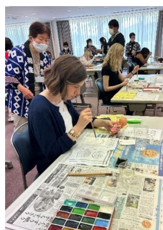
が づ に ち す い こ げ ん え て が み き ょ う し つ 5月24日(水)午前 絵手紙教室