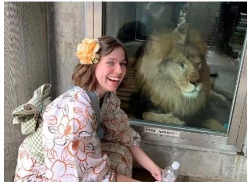
5月20日(土)着物・茶道体験