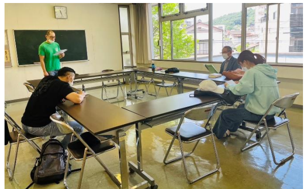
第1期日本語検定コースの様子