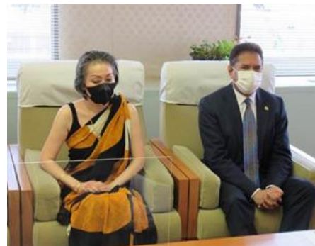
ペレラ駐日大使ご夫妻