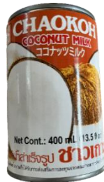
ココナッツミルク