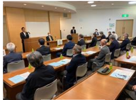
あらかしちょうあいさつ 荒木市長挨拶