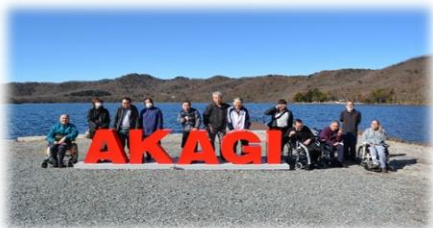
自然探勝会・赤城大沼にて

～つなぐ つながる つなげる～ ご利用される方の意欲的な生活を尊重し、自主性、主体性など必要な力を育て、且つできる限り快適な生活を過ごせるよう配慮します。現在男性18名、女性9名の方が利用されています。年齢層は33歳～81歳、平均年齢は約64歳です。午前の活動は、全員参加の支援を行い、個々の能力や状況に合わせ笑顔で楽しく参加していただけるよう活動内容の工夫をしています。健康第一で生活することを心掛けています。