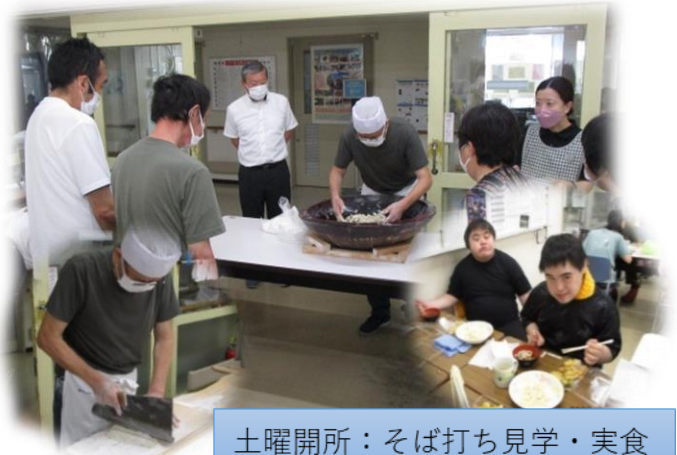
土曜開所：そば打ち見学・実食

年間22日間の土曜開所にて余暇支援を実施します。文化的支援（アート書道、絵手紙）、外出支援（外食、日帰り旅行、そば打ち見学）など、多種多様な活動を提供しています。