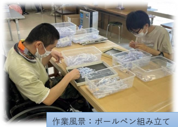
作業風景：ボールペン組み立て