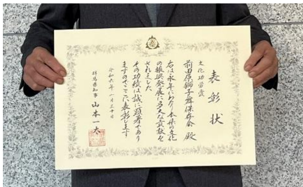
文化功労賞 団体の部

令和6年1月30日群馬県庁昭和庁舎において「令和5年度 群馬県文化賞の表彰式」が開催され【前田原獅子舞保存会】が表彰されました。