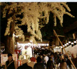
祝 桐生西宮神社大祭