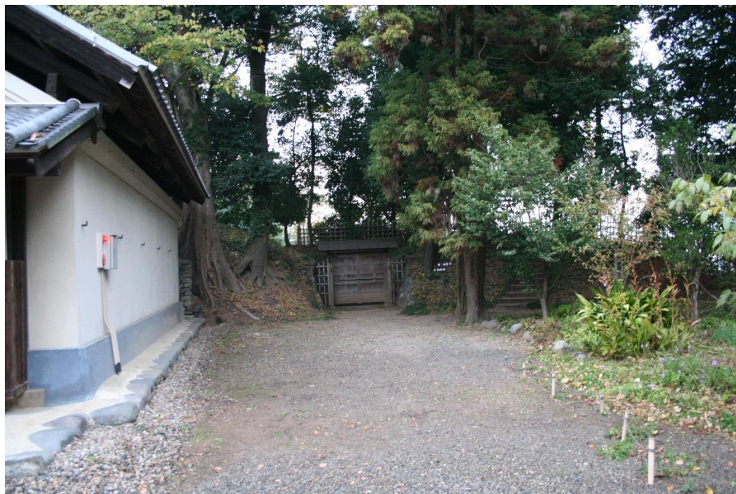
穀倉、搦手門、櫓台跡