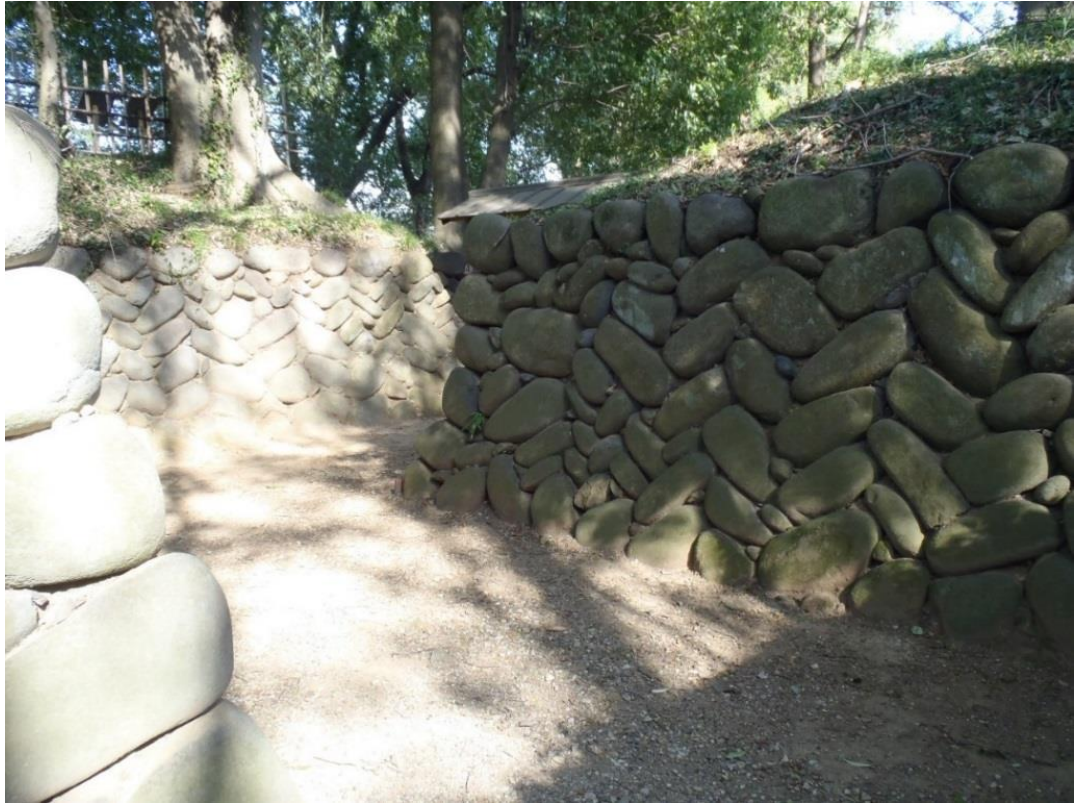
搦手（玉石で矢筈状に組む）