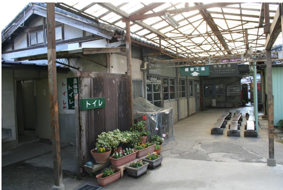
旧現場事務所（経糸整経場）