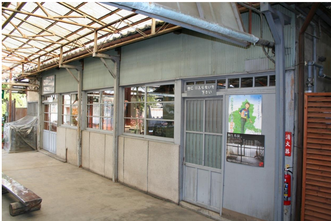
旧現場事務所（経糸整経場）

森秀織物工場の北側で通路を挟んだ主屋事務所の東側に位置し、大正13年創建時の建物と考えられる。木造平屋建、切妻造瓦葺で、小屋組はトラス形式の洋小屋となっている。南北(桁行)9.5m、東西(梁間)4.75mであるが、この東側には西辺10.44mを底辺とする北辺3.8m、南辺1.9mの三角形形状下屋が取り付く。これは敷地に併せて増築されたと考えられるもので、ボイラー室であったという。現在は経糸整経場として使われている。