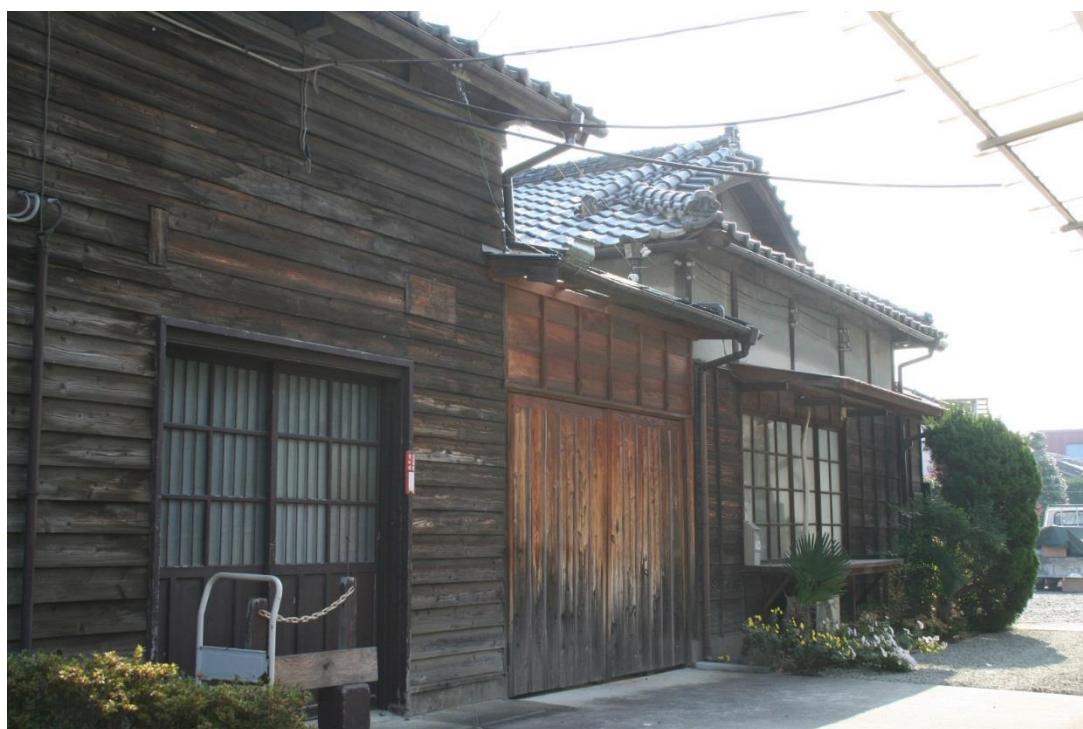
旧寄宿舍 1 東面 (製品加工場)