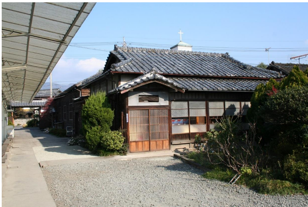
旧寄宿舍 1 (製品加工場)

木造平屋建、入母屋造瓦葺で、小屋組は和小屋である。外壁は押縁下見板張とし、純和風造りとなっている。南に面して建つもので、西寄りに玄関を設ける。玄関東脇から南に面して幅 0.94m の廊下が廻り、その突き当たりの南東角には便所があった。この廊下に面して二間続きの 10 帖となっており、北側にはそれぞれ 2 つの押入れ取り付けられている。押入れは上下二段で、それぞれ寄宿人が使い分けたということから、一部屋 10 帖に 4 人が生活していたと考えられる。現在、東側に押入れが設けられているが、本来この部分も廊下で南から東にかけて廊下が廻っていたと思われる。この建物も大正 13 年の創建時と考えられる。