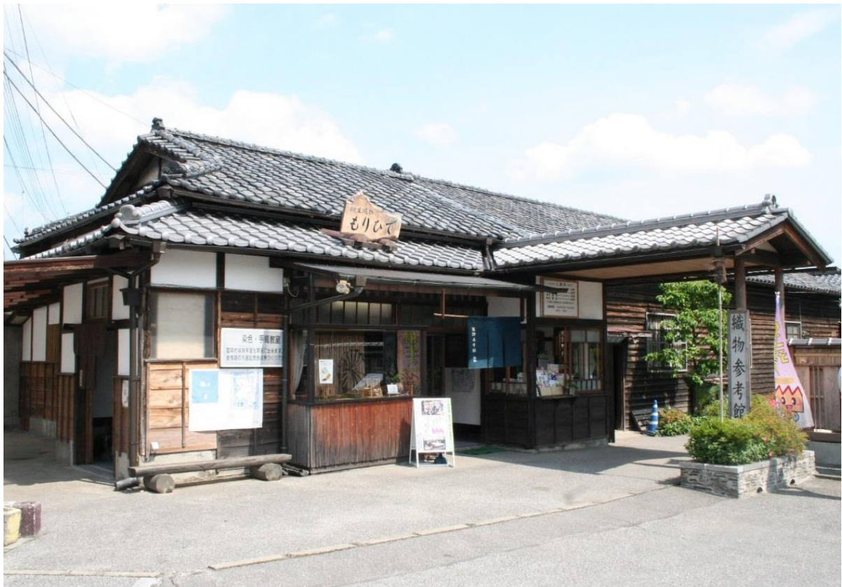
旧寄宿舍 2 (現在 織物参考館「紫」受付及びミュージアムショップ)

この建物は織物参考館「紫」を開館するに当たって、市道の北側にあったものを現在地に引き移転したものである。木造平屋建、入母屋造瓦葺で、その規模は東西(桁行)6.58m、南北(梁間)7.52mとなっているが、南側は移築にあたり切り離されたと思われる。西面から北面の一部にかけては下屋が回り、南西角に突出した受付と新たな門が増築されている。また、東側には敷地に合わせた北辺0.70m、南辺1.37mの三角形の下屋が増築されている。内部は織物参考館「紫」の受付とミュージアムショップとして整えられ、すべての間仕切りは撤去され、床はコンクリート叩きに改造されているが、大正13年の創建当初の建物と考えられる。