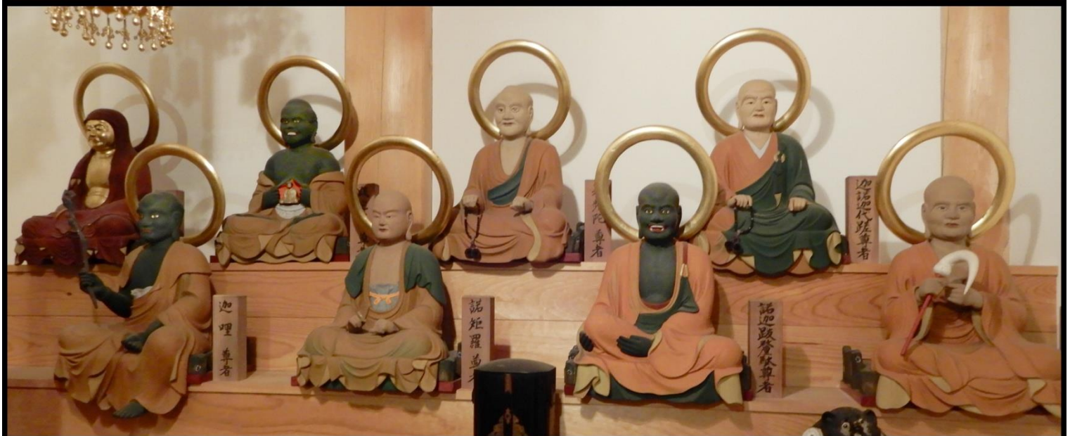
現在は本堂南側の開山堂内に安置されている十六羅漢像