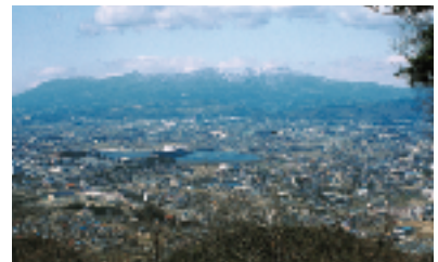
茶臼山山頂から赤城山を望む