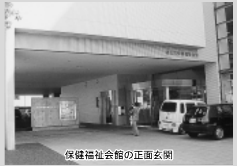
保健福祉会館の正面玄関