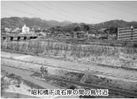
昭和橋下流右岸の間の島付近

エーションの場として、広場や散策路等を整備するもので、平地が少ない桐生市にとっては重要な事業である。平成十三年度には、昭和橋下流右岸の間の島地区においても河川緑地整備事業が始まると聞いているが、どのような予定か。