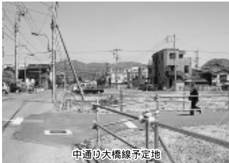
中通り大橋線予定地

答弁 左岸側の平成十三年度末の用地補償ベースでの進捗率は約九十八パーセントとなる見込みであり、平