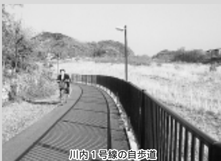
川内1号線の自歩道

質問 川内一号线の自歩道整備は、全体計画の相川橋から小倉峠までの延長約一・二キロメートルのうち、二百五十六メートルの区間が供用されたところであるが、今後の整備計画はどの