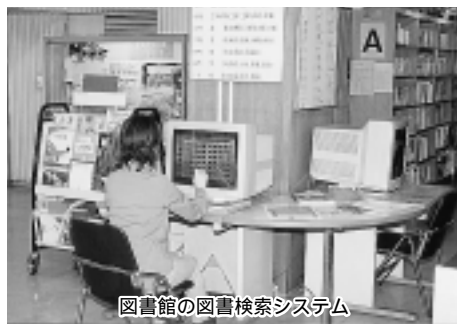
図書館の図書検索システム

新しいシステムへ移行すると、昨今のコンピュータ機器及び周辺機器の改良により、コストダウンが図られるものと考えている。