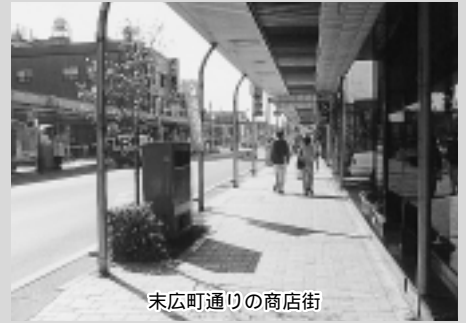
末広町通りの商店街

答弁 来街者の利便性だけでなく、地元住民や通過する人たちが、あらゆる角度から交通環境を検討しなければならぬ問題であり、関係機関と十分協議を行う