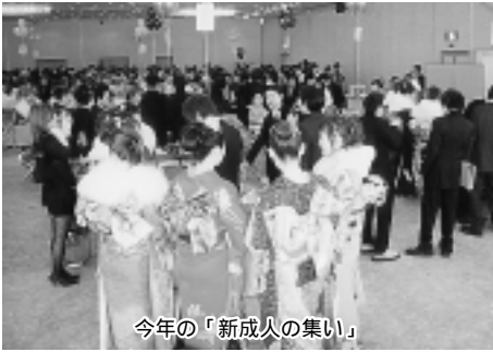
今年の「新成人の集い」

答弁 桐生市では平成十一年度から、新成人の意志を尊重し、式典終了後に新成人の集いを実施している。