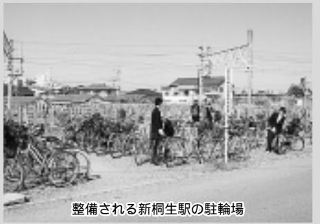
整備される新桐生駅の駐輪場