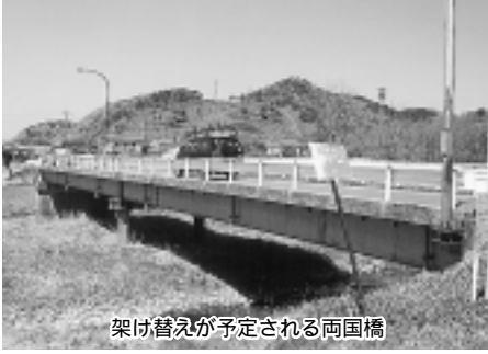
架け替えが予定される両国橋

住民から、通学の子供たち等が両国橋を安全に利用できるように、歩道を設置してほしいとの要望が出されたが、両国橋に歩道を設置することにしているが、どのように考えているか。