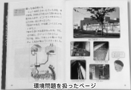
環境問題を扱ったページ