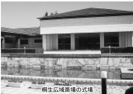
桐生広域斎場の式場

ことや、通夜室から式場に場所を移すことが不便であること等から、式場で通夜が行えるように、組合で協議を進めているようである。