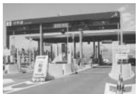
(伊勢崎インターチェンジ)