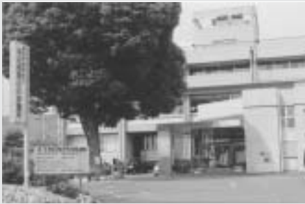
(平日夜間急病診療所)

ターを、合併で目指す中核市の新都市構想の一つとして、救急救命センターに併設しようとする構想である。