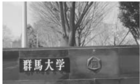
(群馬大学荒牧キャンパス)