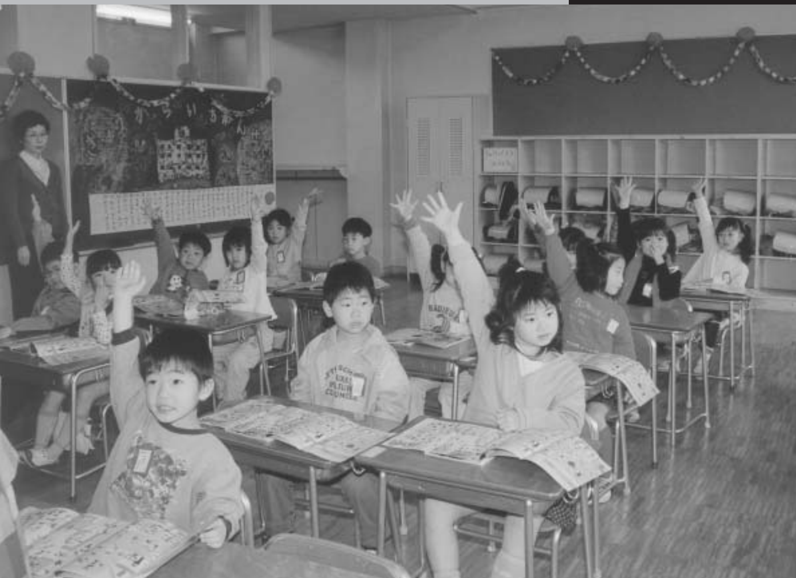
元気いっぱい新一年生（神明小学校）

平成15年第1回定例会は、3月4日（火）に招集され、24日（月）までの21日間の会期で開かれました。