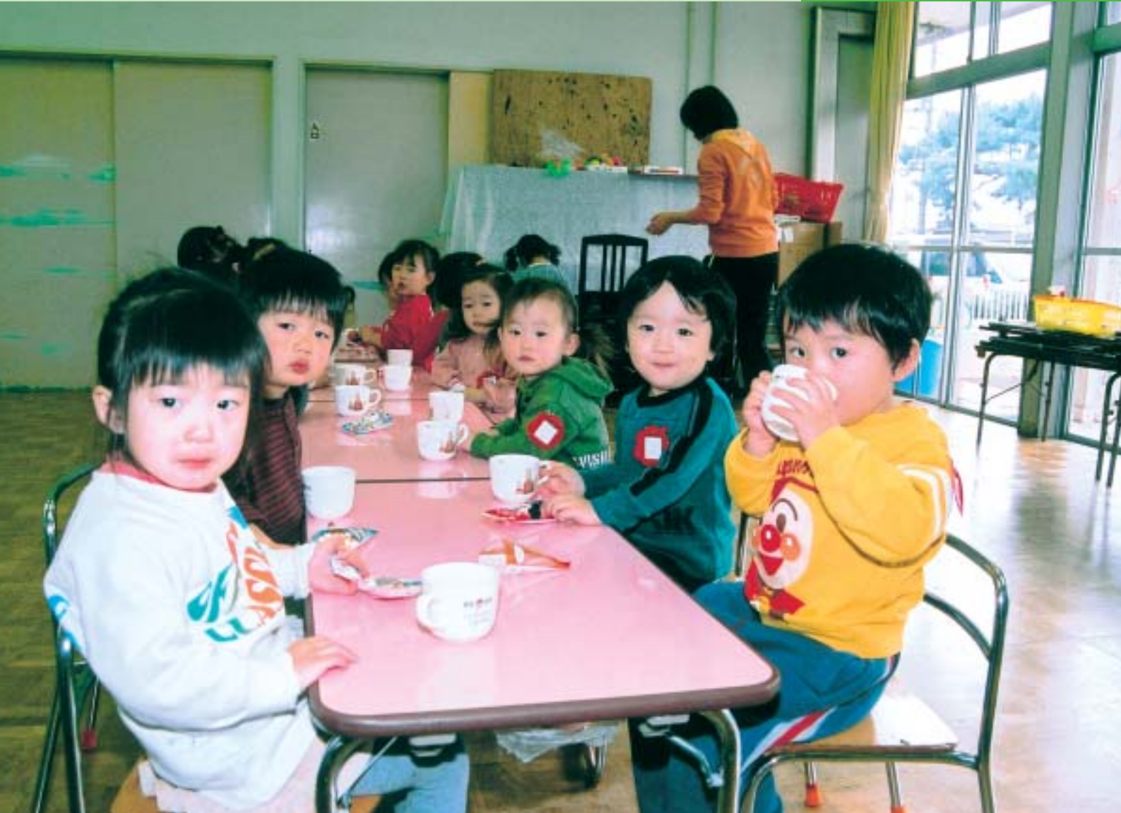
楽しいおやつの時間（相生保育園）

平成18年第1回定例会は、3月2日（木）に招集され、3月24日（金）までの23日間の会期で開かれました。