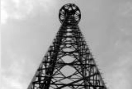
(携帯電話中継基地アンテナ)

う働きかけたい。また、インターネット高速回線についても、地域の動向を見ながら必要な支援に努めたい。