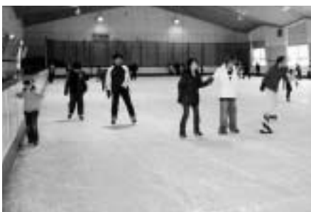
(東スポーツセンター)

答弁 東スポーツセンターは、現在アイススケート場のみを（財）桐生市施設管理協会への運営委託により営業している。本施設の利用者の中からは、毎年団体に出場している選手も多く、平成十七年度は例年以上の利用者数となっている。今後も利用増を図るため、利用者の意見を参考にし