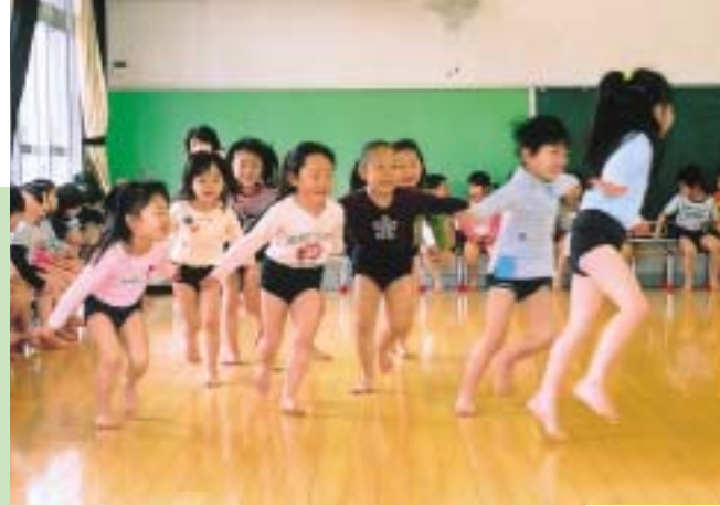
(元気にリズムあそび)

この定例会では、次の意見書案を原案のとおり可決し、 内閣総理大臣ほかに送付しました。