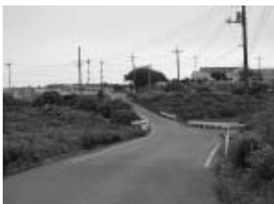
（新里町芝工業団地の周辺道路）

模拡張を視野に入れた適地として山上工業団地周辺地区を選定しているが私有地なので、具体的な立地動向に際して調整が必要となる。