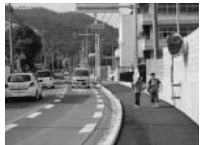
（川内南小学校西門前の歩道）

答弁 県道駒形大間々線の川内南小学校西門付近の区間については、もともと歩道幅員が非常に狭く、児童生徒をはじめ地元住民の通行の際に危険であったことから、平成十九年度に、県の交通安全対策事業として、西門より南側の約五十メートルの区間について歩道拡幅工事が実施されたところである。