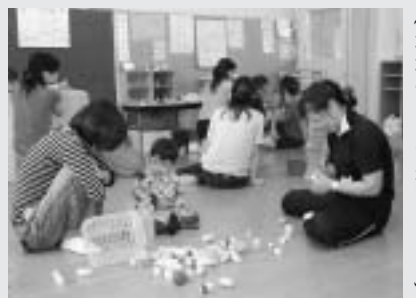
（地域子育て支援センター）

質問 子育て世代の定住促進に向けた施策はどうか。 答弁 次世代育成支援行動計画後期案作成に向けて「仕事・育児の両立支援の