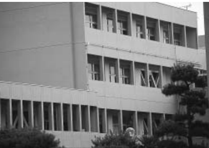
(耐震改修済みの商業高校)