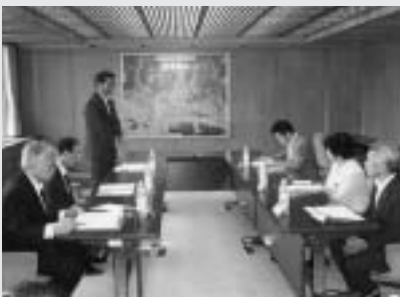
（桐生・みどり連携推進市長会議）

質問 新法期限内にみどり市との合併を実現するための任意及び法定協議会設置のスケジュールはどうか。