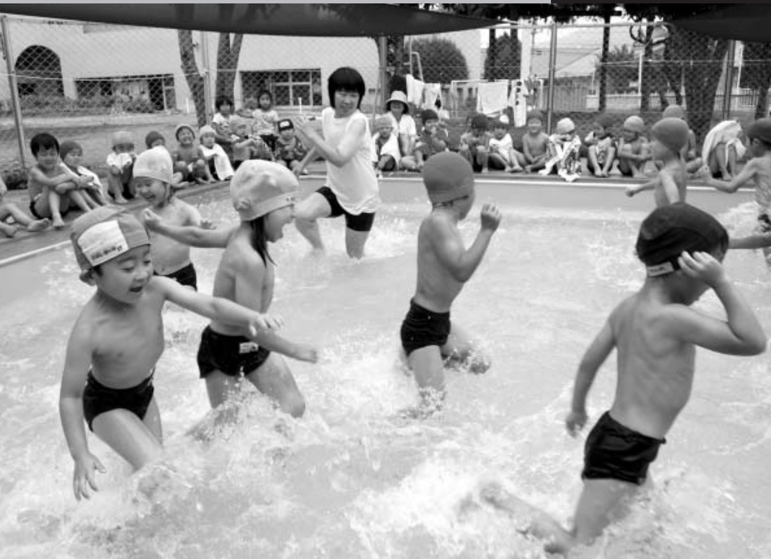
プール遊びを楽しむ園児たち（みつぼり保育園）

平成20年第2回定例会は、6月5日(木)に招集され、6月20日(金)までの16日間の会期で開かれました。