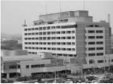
（桐生厚生総合病院）

答弁 ここ数年で医師が最も多かった平成十八年度と現在を比較すると、精神神経科で一人、神経内科で二人、循環器科で二人、外科で二人、整形外科で一人、心臓血管外科で二人、全体で八人の減員となるが、大学医局の人事異動がその主な要因と聞いている。今後の対応として、関係大学、