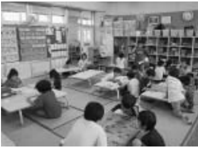
（放課後児童クラブ）

質問 保育料の均一化及び大規模クラブ分割に備えた運営マニュアルの作成や地域の運営委員の負担軽減に関する市の見解はどうか。 答弁 保育料の均一化のための給料表作成の検討や