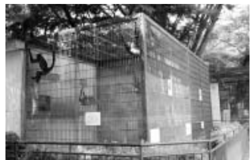
(現在の動物園クモザル舎)