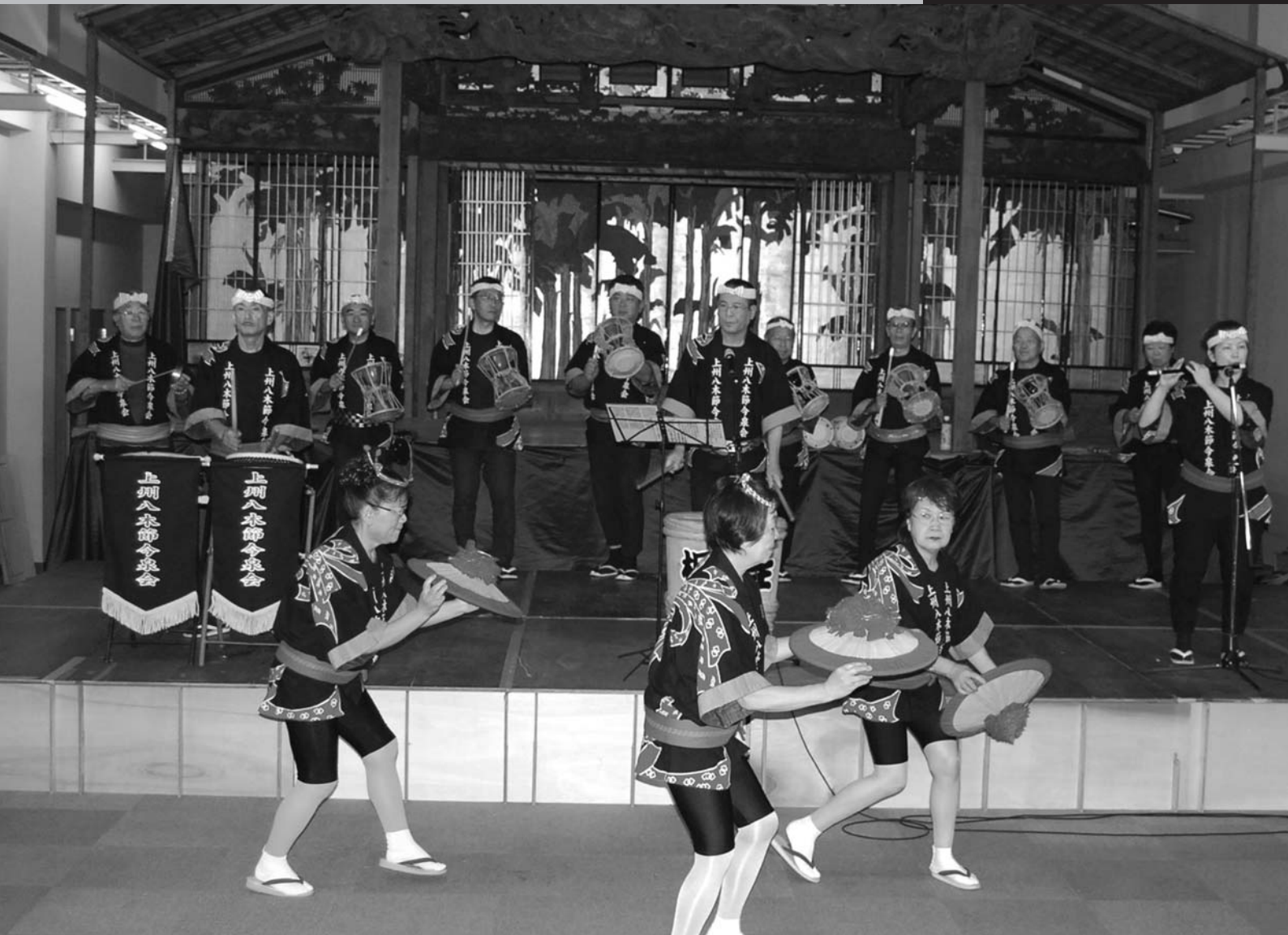
桐生八木節交流広場（あーとほーる銚座）

平成24年第2回定例会は、6月8日(金)に招集され、6月27日(水)までの20日間の会期で開かれました。