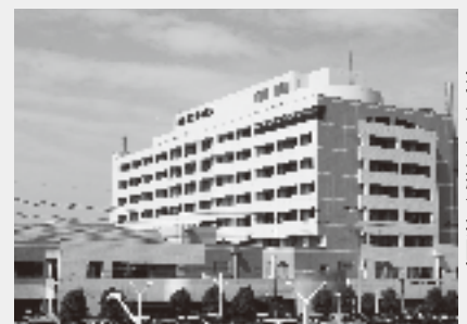
(桐生厚生総合病院)

質問 類似病院では離職率が高い状況にあるが、厚生総合病院における看護師の離職状況と人員確保策は。 答弁 昨年度は十四人が退職し十七人を採用した。