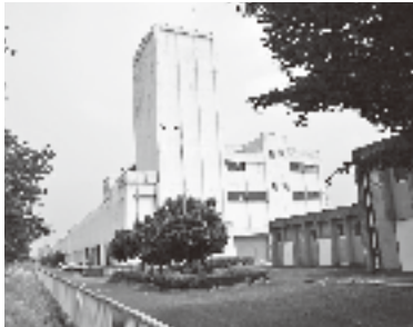
（境野水処理センター）

答弁 平成二十一年度より長寿命化支援制度を利用し、老朽化の著しい汚泥処理施設から詳細調査、耐震診断、計画策定等を実施してきた。また、水処理施設は、調査が広範囲のため詳細調査、耐震診断を部分的に実施してきた。汚泥処理施設と旧事務所、水処理施設及び屋上運動公園の耐震診断を実施した結果、建設