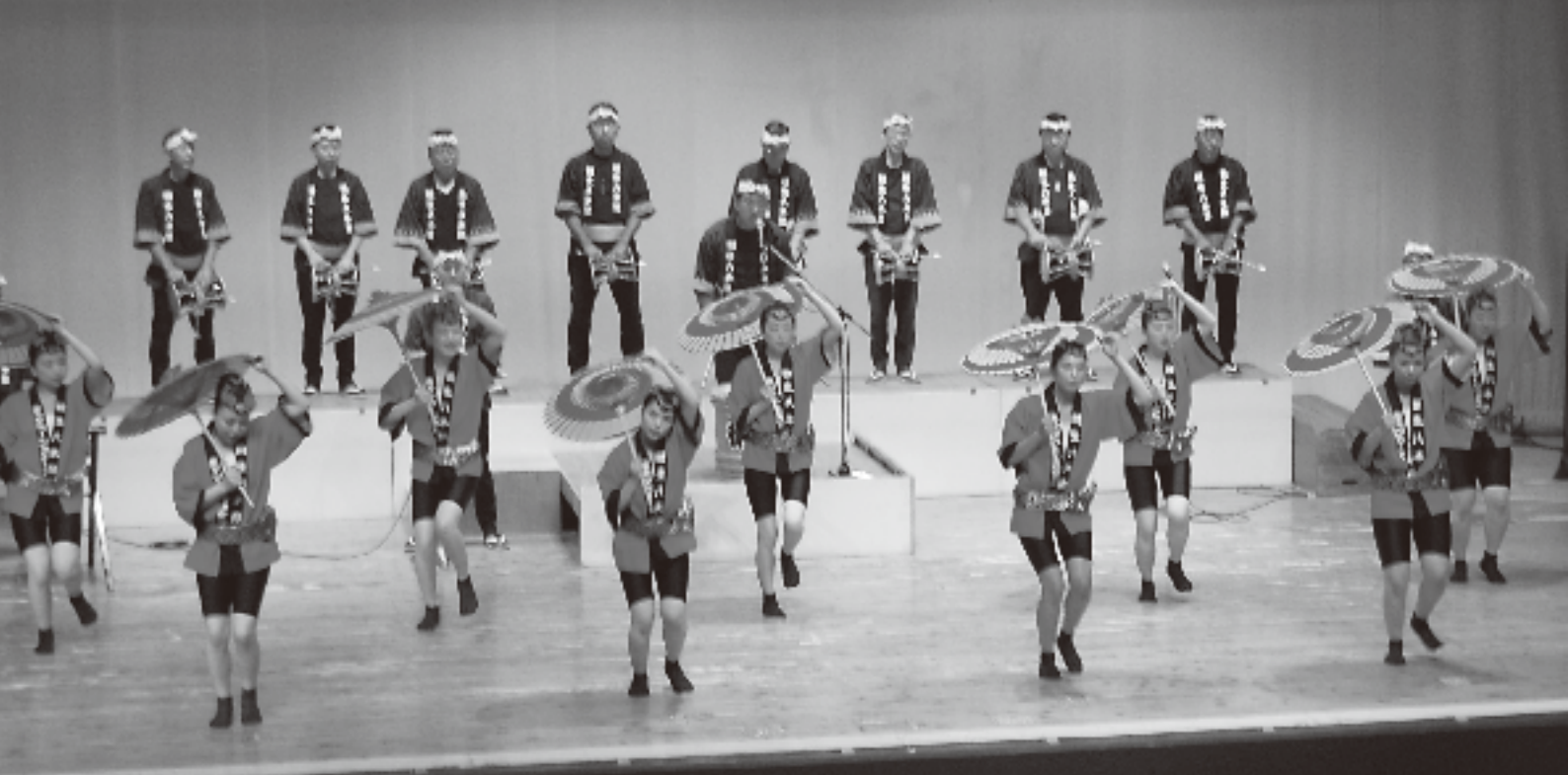
平成25年度桐生八木節キャンペーンスタッフ八木節踊り披露（中央公民館市民ホール）

平成25年第2回定例会は、6月7日（金）に招集され、6月26日（水）までの20日間の会期で開かれました。