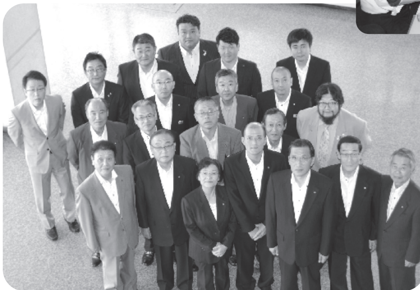
(順番で出演する桐生市議会議員)