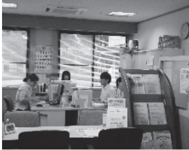
（市内の地域包括支援センター）

答弁 地域包括支援センターの設置運営については、高齢者数が概ね三千人から六千人未満の圏域ごとに保健師一名、社会福祉士一名、主任介護支援専門員一名を置くこととされている。第五圏域である黒保根町と新里町の高齢者人口合計は平成二十三年十月一日現在で、四千四百二十九人で、設置