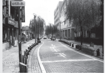
（都市景観（かに川通り））