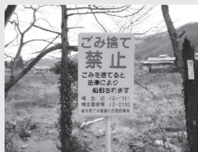
（ごみ捨て禁止の看板）

例を策定する考えはあるか。 答弁 犬の糞害等については、現在のところ、「群馬県動物の愛護及び管理に関する条例」に準じているが、ポイ捨て等の環境へのマナーを含めて、今後不法投棄防止条例に係る啓発活動に努め、環境美化の意識の高揚を図り、市民参加の環境づくりに努めていきたい。