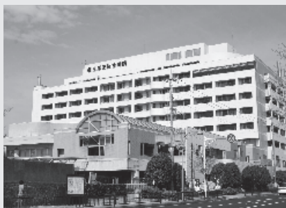
(桐生厚生総合病院)

答弁 より良い医療体制を提供するためには、人的物的の両面で改善が必要である。具体的には、医師確保の面においては、直接、大学に向き医師の派遣を依頼した成果として、常勤医師の増員につながっている。また、新たな医療機器の導入による診療体制の改善、病棟の改修や病床の増