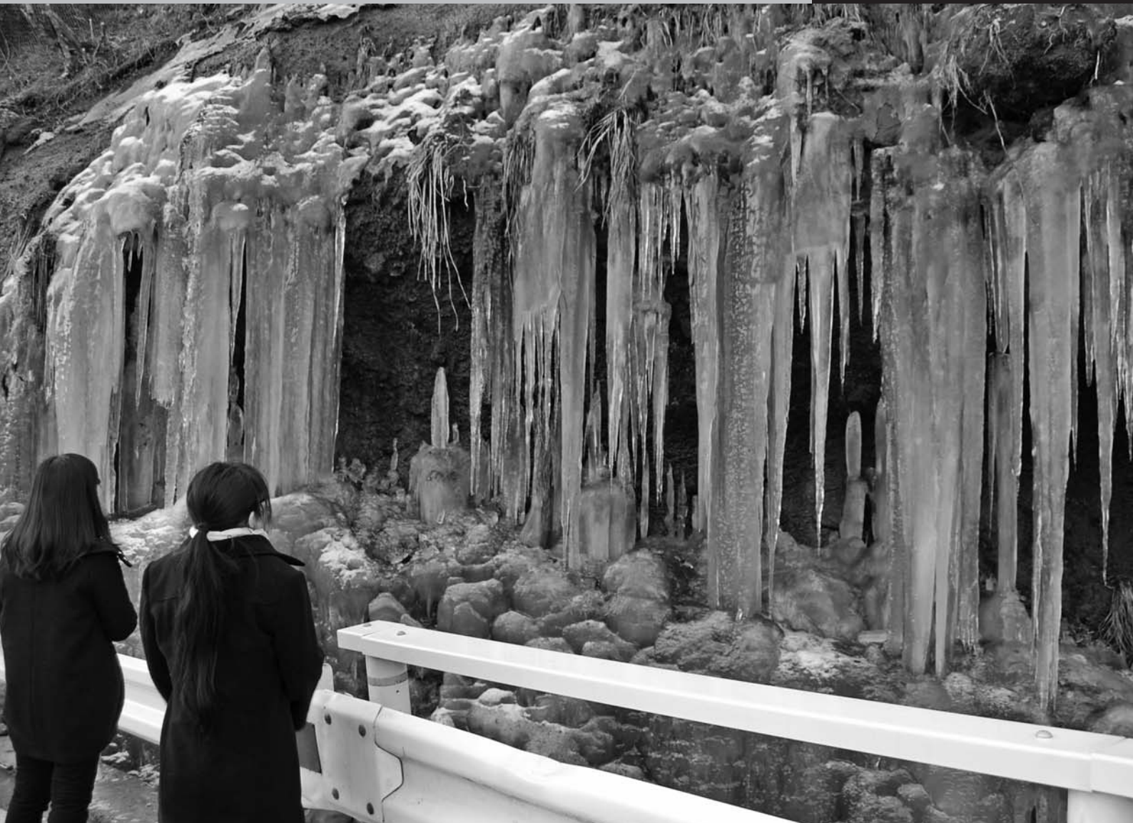
梨木の氷柱（黒保根町宿廻）

平成26年第4回定例会は、11月28日(金)に招集され、12月18日(木)までの21日間の会期で開かれました。