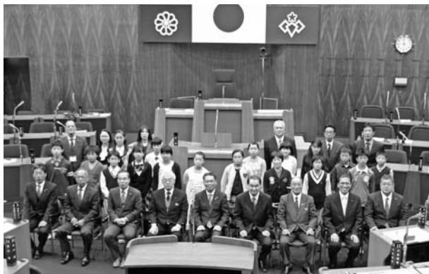
(参加者による集合写真)

市内の各小学校から選ばれた17人の児童が、「『わたしの夢見る未来の桐生』に対する自分の夢、願い、希望すること」を提案し、市政について様々な意見や提案を発表しました。