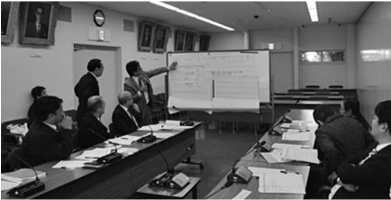
(特別委員会での協議の様子)