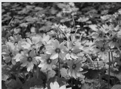
(鳴神山のカッコソウ)

質問 絶滅の危機に瀕している鳴神山とその周辺に自生するカッコソウについて、種の保全の取り組みは。