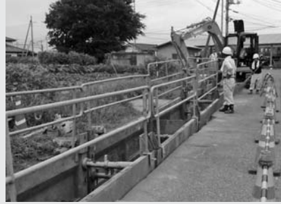
(下水道工事の様子)

答弁 平成二十七年三月三十一日現在で、川内地区では、七十七・六二ヘクタールの整備が終わり、進捗率は五十二・五％。新里地区は、二百十五・七六ヘクタールの整備が終わり、進捗率は七十九・三％である。今後の予定は、川内町では県道川内堤線と県道駒形大間々線の交差点付近ほか