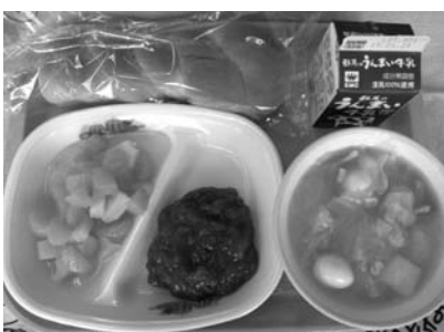
(学校給食のイメージ)

質問 第三子以降の給食費については無料化されたが、子育て支援及び人口減少対策の観点から、全ての給食費を無料化すべきでは。