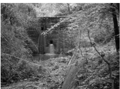
(八王子丘陵砂防堰堤)

答弁 八王子丘陵砂防堰堤を管理している群馬県桐生土木事務所にお問い合わせたところ、現状では維持管理上、支障は無く、土砂の