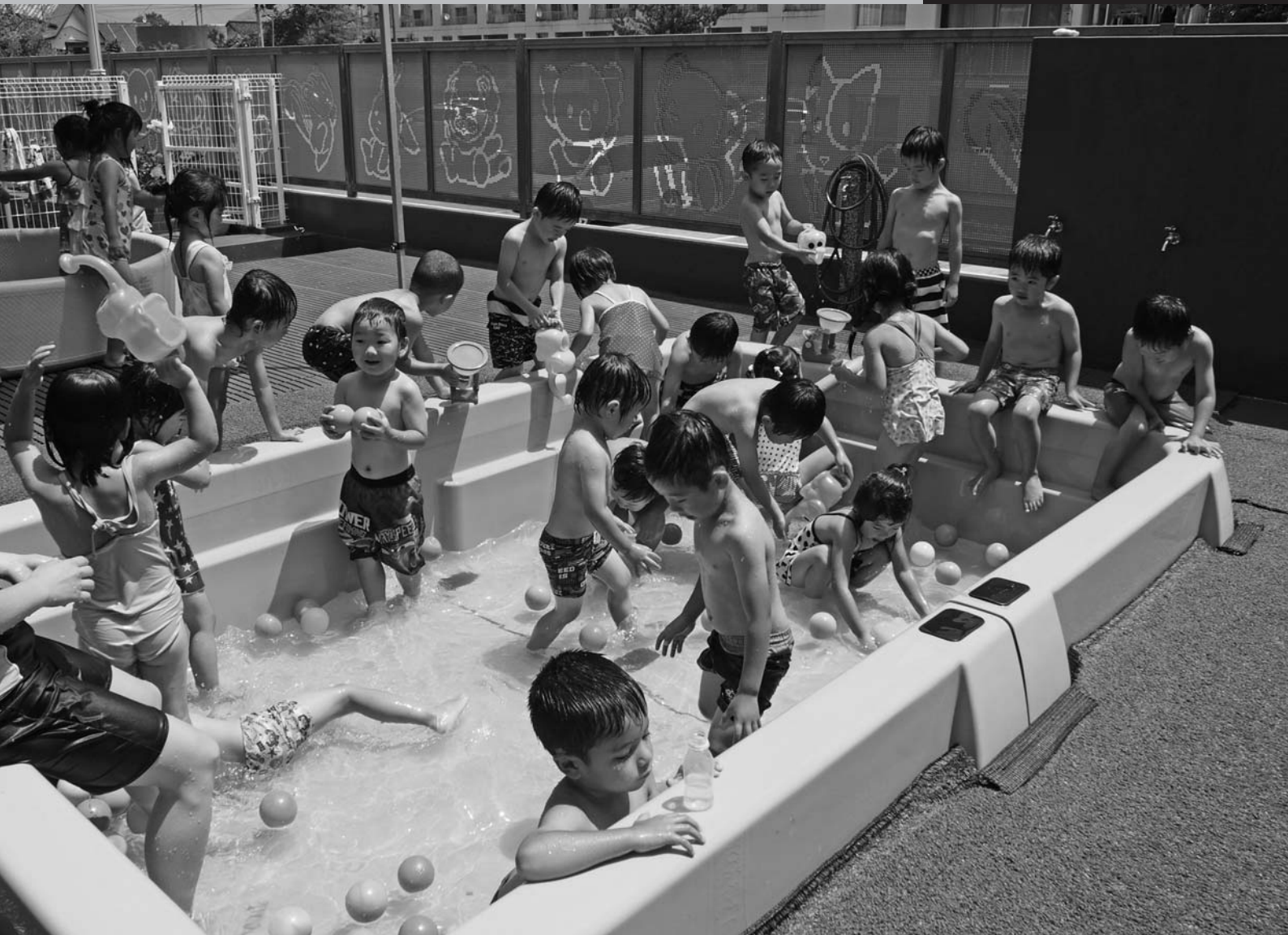
プールを楽しむ保育園児

平成27年第2回定例会は、6月12日(金)に招集され、7月1日(水)までの20日間の会期で開かれました。