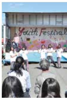
青年祭も企画します

スポーツや様々な活動を通じて仲間作り、友達作りをしてみませんか。料理、レザークラフト、ピラティス、ボウリング、桐生市青年祭、スキー・スノーボードツアー、懇親会などを予定しています。