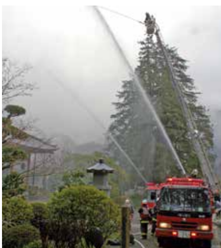
平成26年度に行った防火訓練の様子