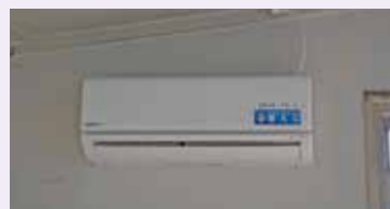
第10区自治会 集会所のエアコン整備