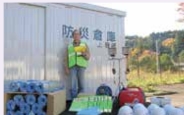
第22区自主防災会 防災倉庫・防災備品整備

公益財団法人群馬県市町村振興協会では、市町村振興宝くじの交付金などを財源として、「魅力あるコミュニティ助成事業」を行っています。この助成事業を利用し、次のとおり防災や集会施設のための備品を購入しました。