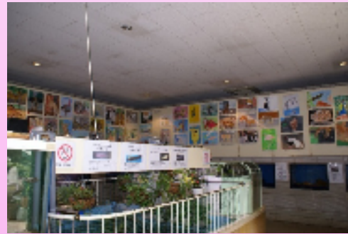
※昨年の入賞作品展示の様子