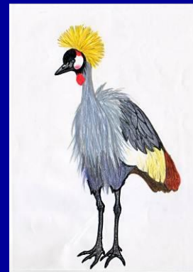
ホオジロカンムリツル