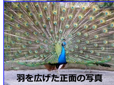
羽を広げた正面の写真