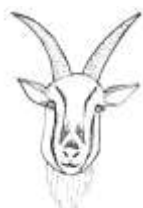
ピグミーゴート種